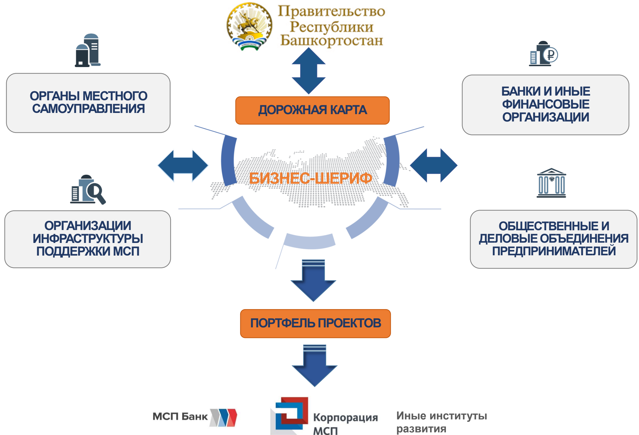
Схема организации работы по взаимодействию с институтами развития